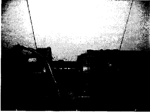
그림 3 실험 셋트

셋트를 제작하였다. 그림 3의 셋트는 각 11kW 유도 전동기와 동기 전동기가 상호 결합(coupling)되어 있는 형태이며 유도 전동기는 부하로 작용하여 일정 속도(constant speed)로 제어되고 있으며, 동기 전동기는 일정 토크 제어로 동작 된다.